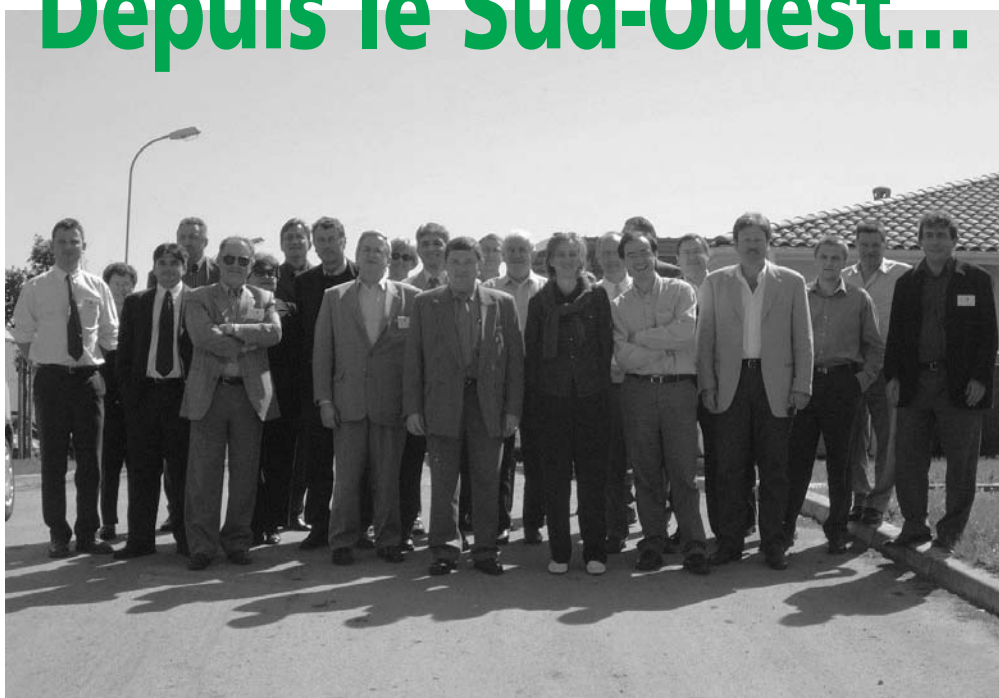
Visite de l'Ecocentre ADONIS