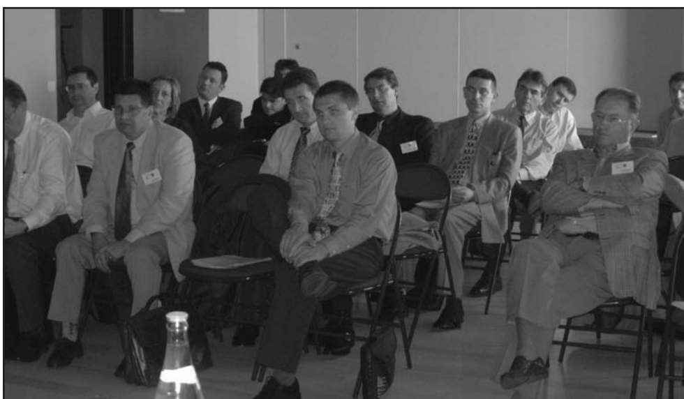
Des adhérents très attentifs

N'oublions pas que ces réunions permettent aux adhérents d'être informés des travaux nationaux et européens en cours dans le domaine des Déchets.