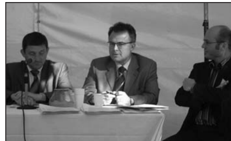
Allocution du Député Alfred TRASSY PAILLOGUES lors de la table ronde