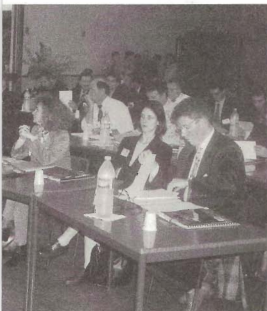
Centre Théodore Botrel

Nous vous avons annoncé, par notre précédent journal, le départ de notre ingénieur. Celui-ci projetait, en effet, d'effectuer une mission humanitaire à l'étranger.