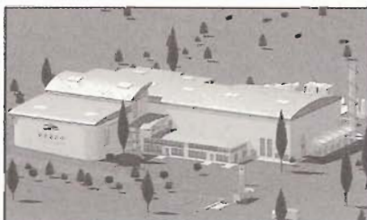
Thermolyse OM et DIB