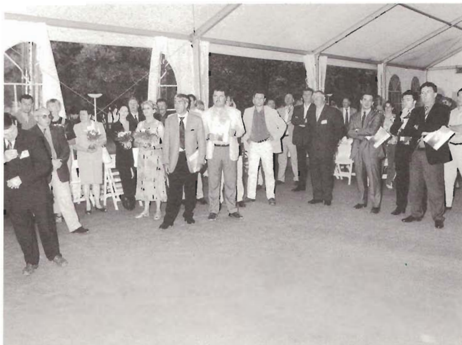
Pendant l'Assemblée Générale